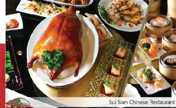
Sui Sian Chinese Restaurant